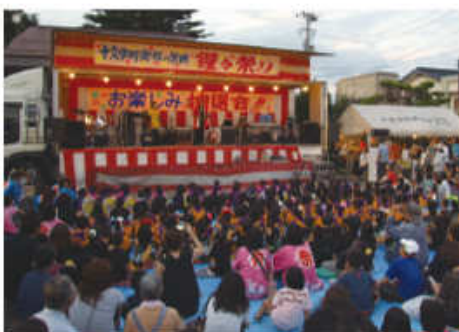
大観衆で溢れる狸々まつり会場