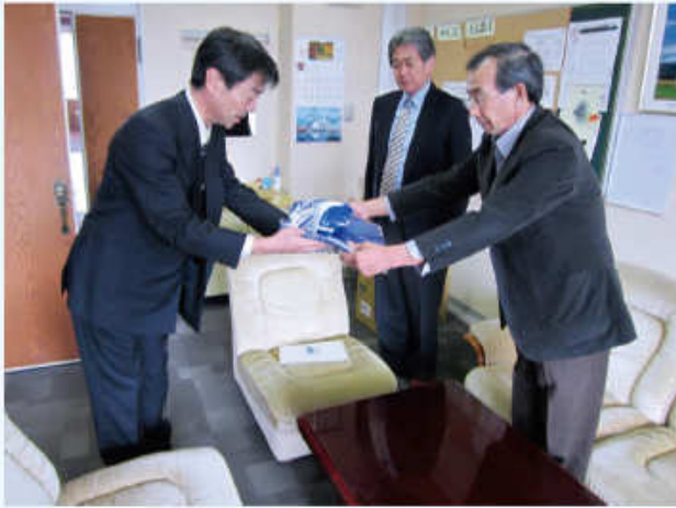
担当の先生に手渡す協議会の正副会長

10月26日十文字地域づくり協議会では、「十文字安全見守り隊」と名前が入った反射材付きジャンパー、帽子、笛の3点セットにして、町内の四小学校に提供しました。 これらは、十文字町の児童の交通事故防止や下校時の安全を守るために、地域で活動しているボランティアの皆様を活用してもらおうと作成したものです。 総勢110名を超えるボランティアの方々と共に、地域全体で子どもたちの安全・安心を見守りたい（見守り隊）ですね。