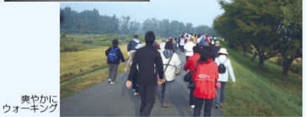
爽やかにウォーキング

今回、予想を上回る参加申込がありまして実行委員が嬉しい悲鳴を上げました。来年はどんな素敵なサプライズがあるかな！お楽しみに。