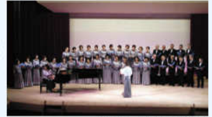
スワンコーラスの発表風景

町の文化交流の拠点施設である文化センターは年数が経ち老朽化が進んでいます。今年是利用頻度が高く傷みの激しい大ホールステージ(床)を改修しました。11月5日～6日には新しいステージで地域の皆さんが芸能発表や演奏など日頃の練習の成果を発表しました。