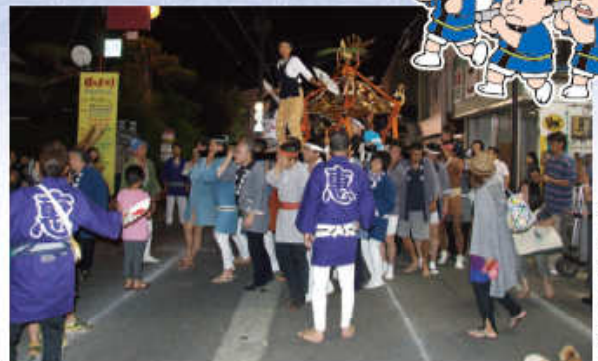
活気溢れる神輿連