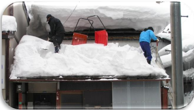
雪下ろし雪寄せ支援事業 自力での雪下ろしが困難な高齢者世帯へ 雪下ろし業者のあっせん及び料金の一部助成費として