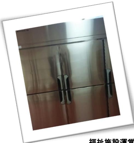
福祉施設運営及び整備事業 厨房用冷蔵庫購入