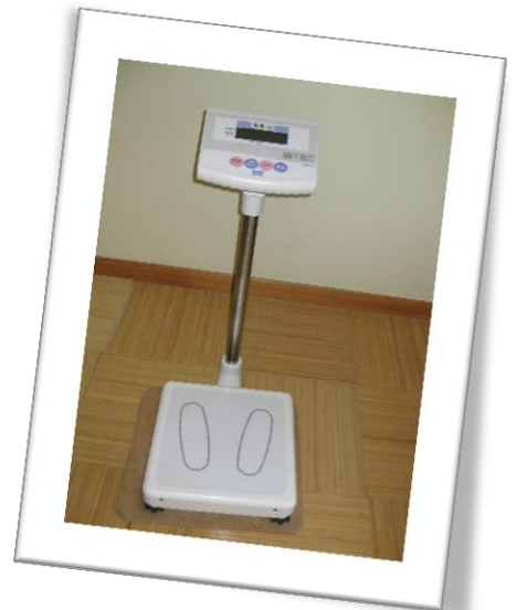
ゆっぶるの維持・運営のために 脱衣室設置用デジタル体重計購入