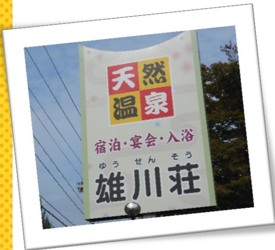
雄川荘のために 既設看板の表示替え工事費用として