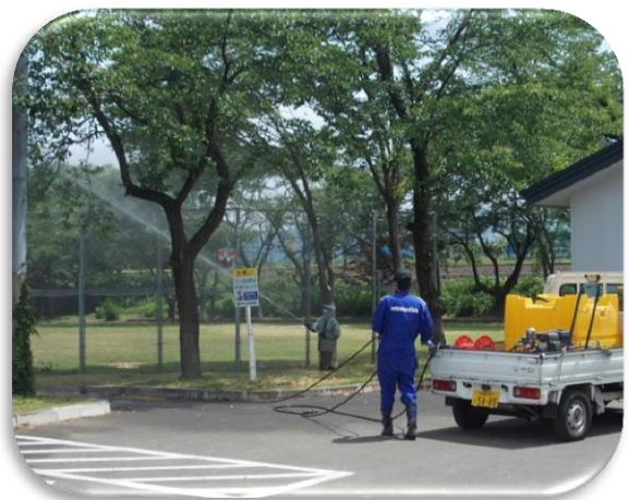
十文字地域の桜植樹のために アメシロ防除薬品代として