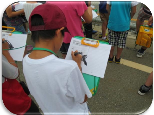
キャリア教育のために 児童の職場見学時記録用ボード、 多色ボールペン購入