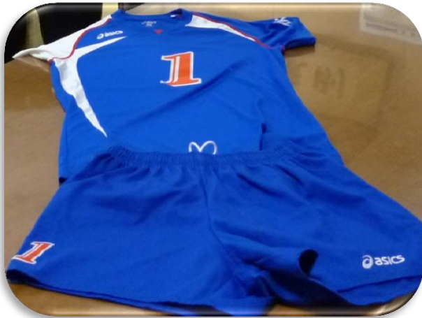
横手南中学校男子バレー部のために ユニフォーム購入