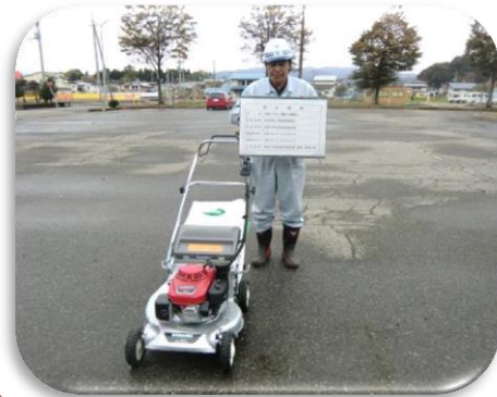
雄物川町のために 雄物川中央公園 自走式草刈り機購入