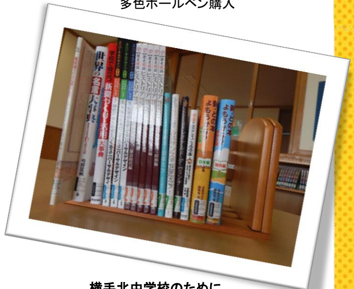
横手北中学校のために 学校図書購入