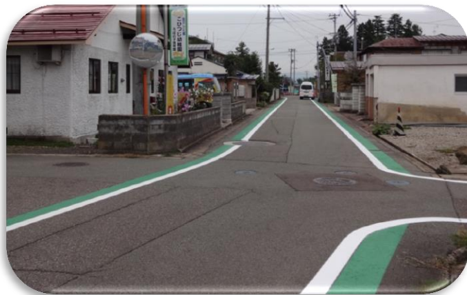
十文字地域の事業のために 市道十文字東町通り線の グリーンベルト設置費用として