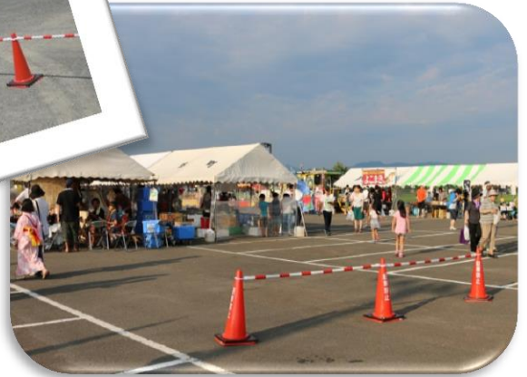
大雄サマーフェスティバル カラーコーン、コーンバー、コーンベッド購入 開催日：H27.7.25