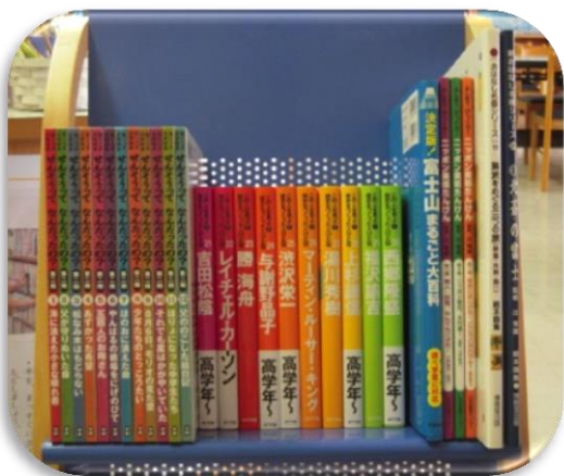
横手南小学校のために 学校図書購入