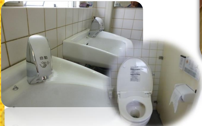
市内小中学校の維持・整備 朝倉小学校のトイレ改修工事費として