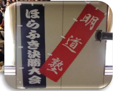
銀河系宇宙ほらふき決勝大会 観覧席用ゴザ、会場設置用幟購入 開催日：H26.1.18