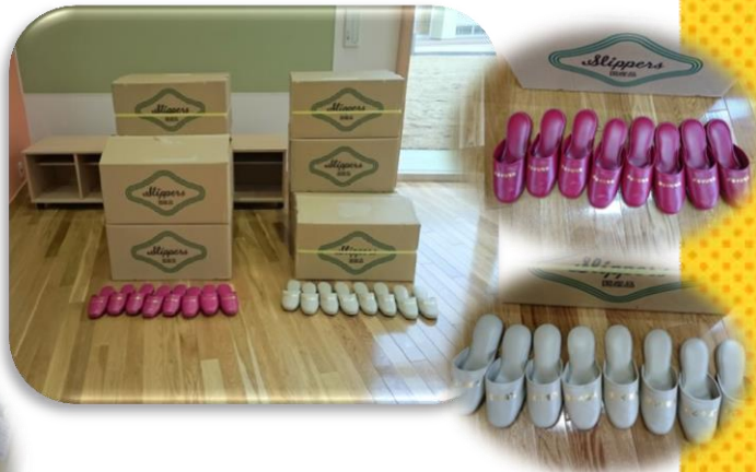
学校統合のために 雄物川小学校、大雄小学校 名入りスリッパ購入