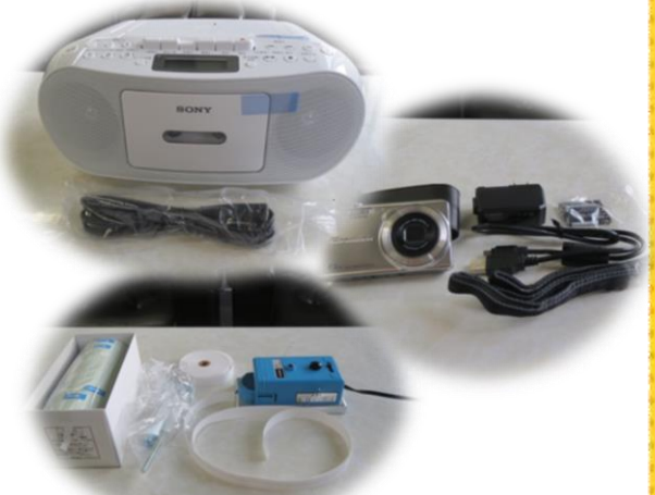
市内小中学校のために 児童生徒学習用教材として教育用CDラジカセ、 デジタルカメラ、記録タイマー購入