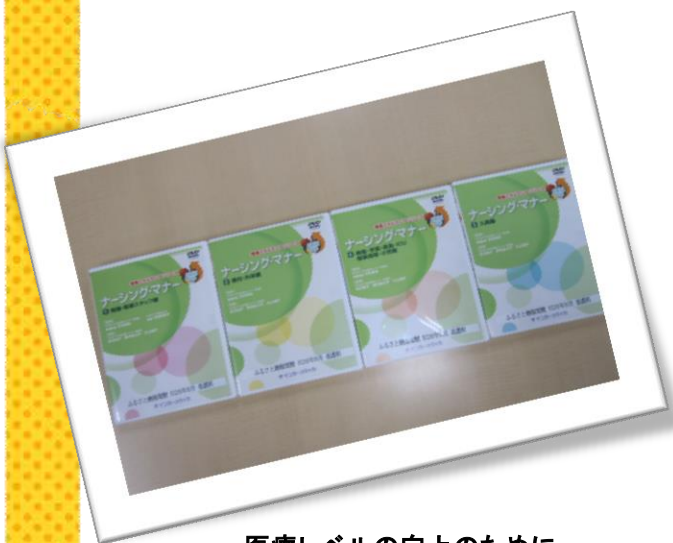
医療レベルの向上のために 医療スタッフ教育用DVD購入 及び接遇研修の実施