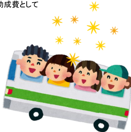
廃止バス路線代替運行事業 乗合タクシー「大森線」 運行事業費の一部として