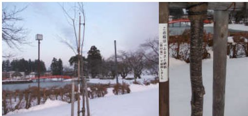
十文字地域のため (梨木公園に桜を植樹)