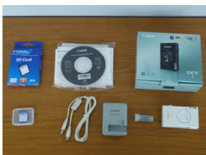
教育関係費(特に小中学校のため) (教育センター用デジタルカメラ購入)