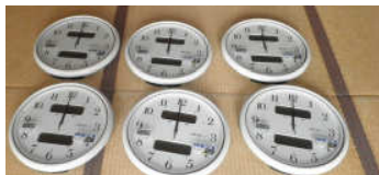
ゆっぶるの維持・サービスの向上へ (防水電波時計の購入)