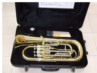
横手南小学校に (横手南小学校へ楽器(トロンボーン、ホルネット、ユーフォニウム) および音楽室で使用するイスを購入しました)