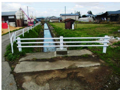
暮らしのみちづくり事業 (危険箇所(農業用水路)へ防護柵の設置)