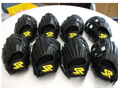
横手南中学校に (体育の授業で使用する ソフトボール用グローブの購入)