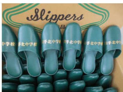
市内小中学校の整備 横手北中学校校名入りスリッパ購入