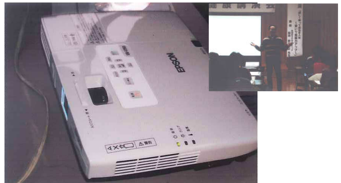
ふるさとの友と親族を応援する(雄物川町のために) (プロジェクター一式(研修会用)購入)