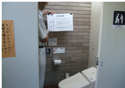
※ 特定事業指定なし 「コミュニティラウンジ」洋式トイレ改修工事