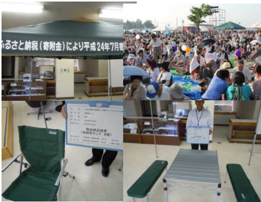
大雄サマーフェスティバル (イベント用テント、テーブル、チェア購入) H24.7.28