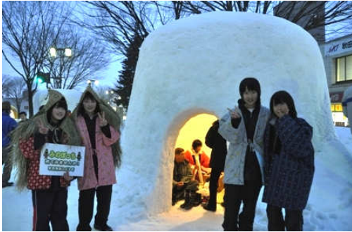
かまくら雪まつり (かまくら内に入る観光客用「みのぼっち」の購入) 開催日: H25.2.14~15