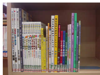
横手南小学校に (学校図書館の書籍購入)