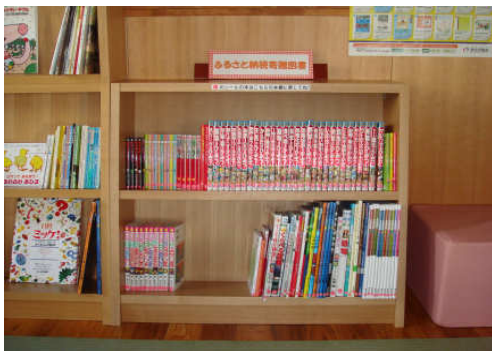
放課後児童対策事業、ふるさとの友と親族を応援する (児童クラブの図書購入)