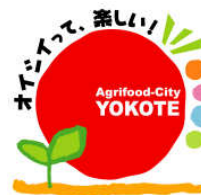
横手市特産品開発支援事業、ふるさとの産業を応援する (特産品の開発事業経費の一部補助)