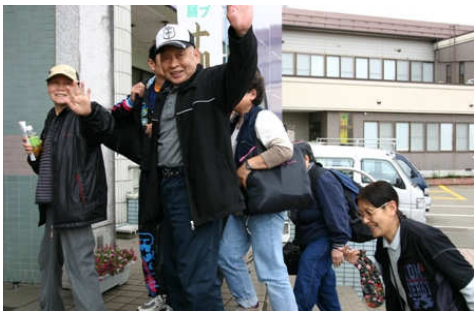
災害地支援 釜石被災地元気回復事業 (釜石市内において避難所に滞在している方々のリフレッシュのため、 横手市内の温泉等宿泊施設に宿泊していただきました。)