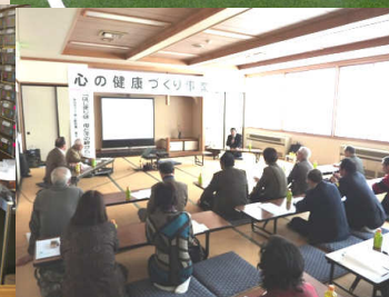
平鹿地域の高齢者福祉施設の施設設備の向上と、同地域高齢者の福祉・健康推進事業に (福祉車両等、除雪機、エアーマット、空気清浄機、ユニカール、電動ベッド、OA機器、システム調剤台、車イスの購入)