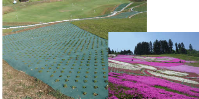
大森リゾート村芝桜フェスタ (補植用芝桜ポット苗の購入) 開催日: H24.5.19~27