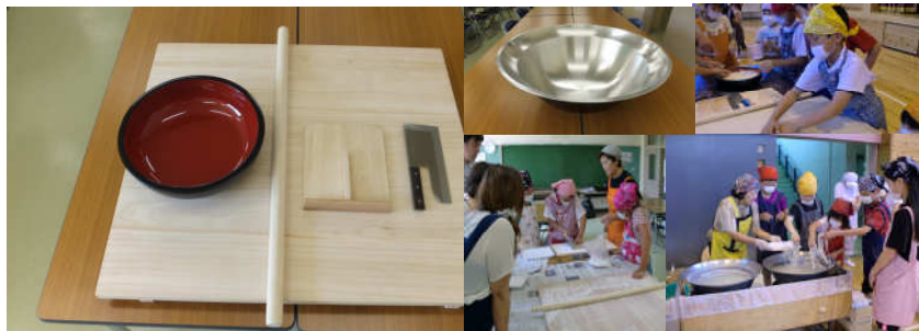
青少年健全育成のために (農山村体験学習交流施設で使用するそば打ちセット、平釜購入)