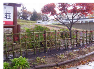
雄物川雄川荘に (雄川荘入口周辺への生垣施工)