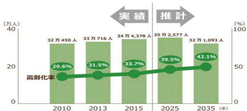
秋田県の高齢者人口