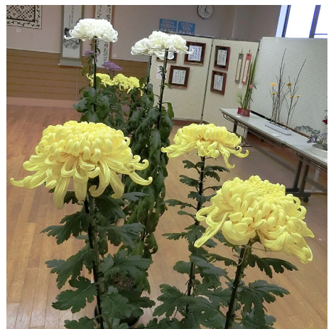
昨年「みんなの作品展示会」に出品された菊鉢