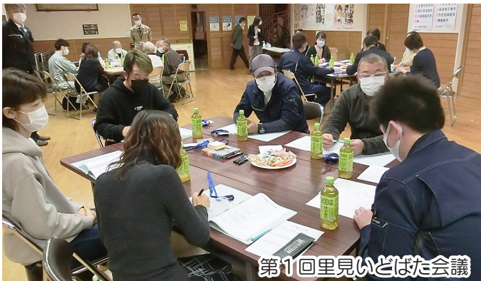
第1回里見いどばた会議