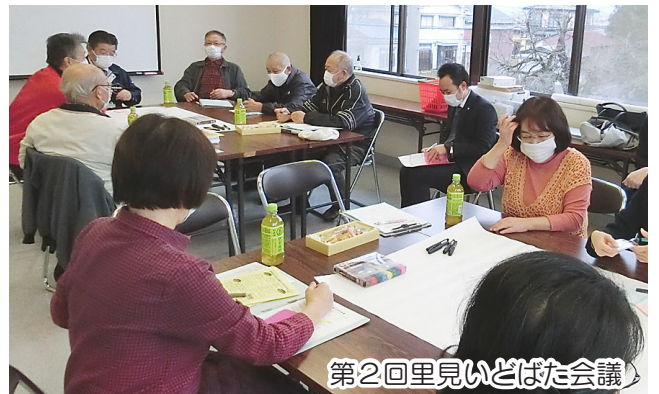
第2回里見いどばた会議