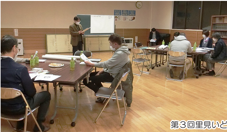
第3回里見いどばた会議