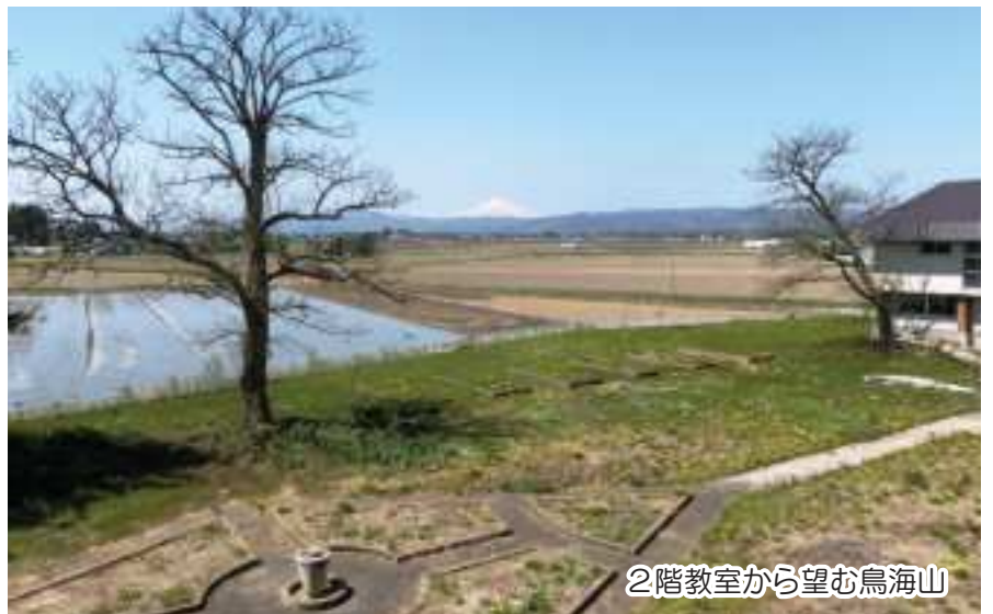
2階教室から望む鳥海山