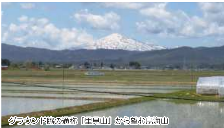
グラウンド脇の通称「里見山」から望む鳥海山