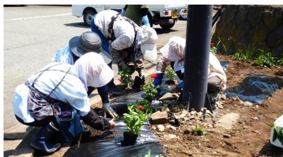
↑アスパルでの作業の様子