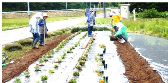
↑二井山での作業の様子