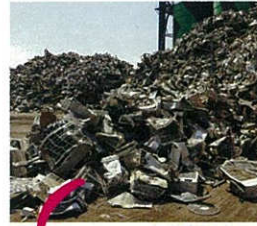
左：エアコンの室外機が目立つ廃家電スクラップの山。

廃家電が積み重ねられたスクラップの山は、電池やプラスチックを含むため発火・延焼の危険性が高く、業者の敷地や輸出港で大きな火災が頻発しています。消火費用は私たちの税金から支出されます。