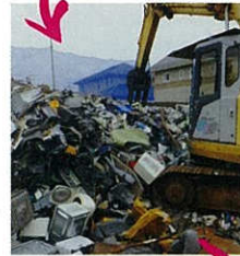
右下：違法に集められた廃家電スクラップの火災が、全国で頻発。