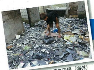
※廃家電の不適正処理の現場（海外） 有害物質が環境中に放出。