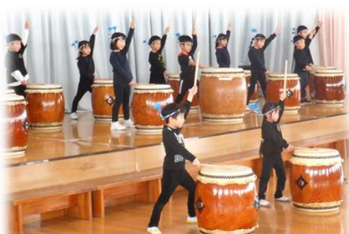
たいゆう保育園年長児による太鼓披露とあーまんと一緒にみんなでダンス

来場者からはオープニングの太鼓披露に「感動した」と喜ぶ声が聞こえたり、餅まきや宝探しに大興奮する子どもたちの姿が見られたりと、大盛況のうちに終わることができました。