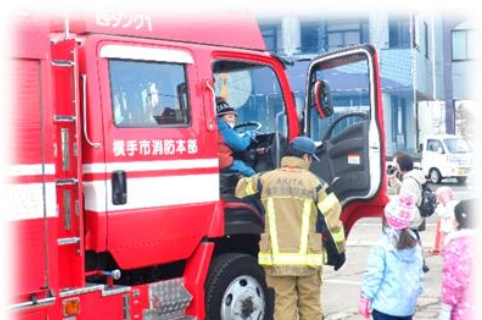
子どもたちが目を輝かせて喜んだ消防車とパトカー乗車体験♪