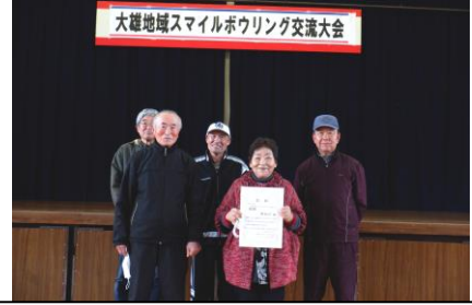
優勝は新町チーム！おめでとうございます