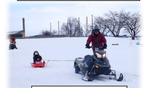
スノーモービル体験