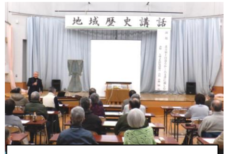
北方領土問題への理解を深めました