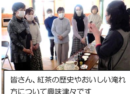
皆さん、紅茶の歴史やおいしい淹れ方について興味津々です