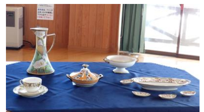
貴重な『オールドノリタケ』の食器を拝見し、その歴史に触れました