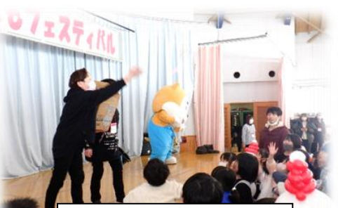
餅まきにみんな夢中