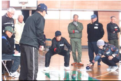
ゲートをくぐらせるのも集中力！