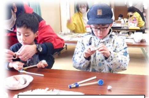
母親クラブはんどはんどによる工作コーナー