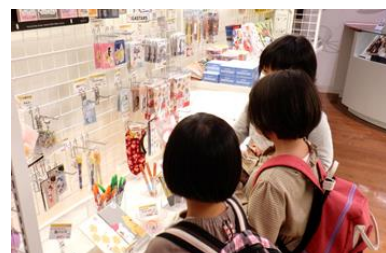
お揃いにしよ♪と仲良くお買物