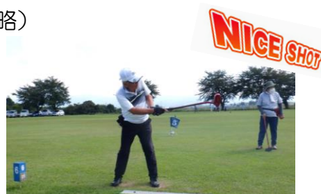
今大会はホールインワンがなんと75本でした！！