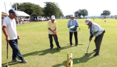
地域に関係なくお互いを応援し、称えあっていました