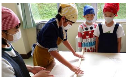
みんなで協力し合い作業します

10月11日、12人が参加し増田町釣りキチ三平体験学習館にてそば打ち体験とまんが美術館を見学しました。そば打ちを初めて体験する子どもたちでしたが、上手に捏ねる・延ばす・切る工程をこなし、自分たちで作ったそばを美味しくいただきました。まんが美術館の売店では買い物体験をし、思い思いに家族や自分用にお土産を購入していました。