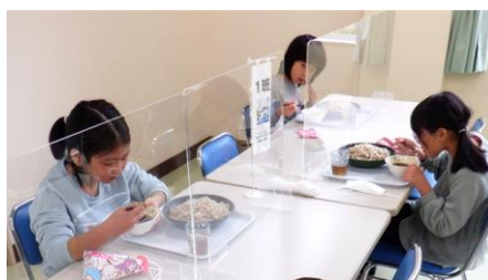
自分達で作ったそばの味は格別です