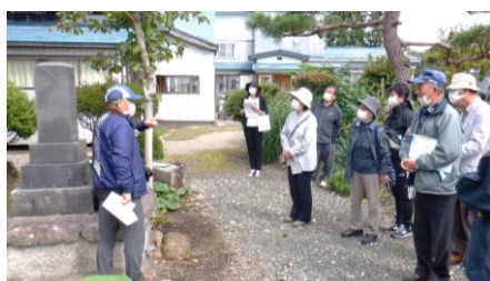
田村の戦いで戦死した一ノ関藩士を供養している下境「萬葉寺」の見学