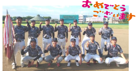
優勝したオソレーズ・フォーチーム