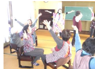
昨年度の笑いヨガ講座の様子