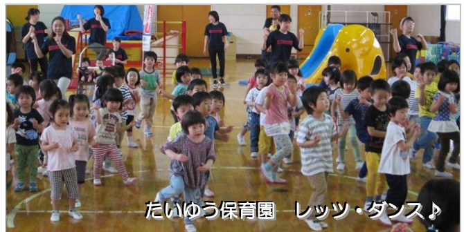
たいゆう保育園 レッツ・ダンス♪