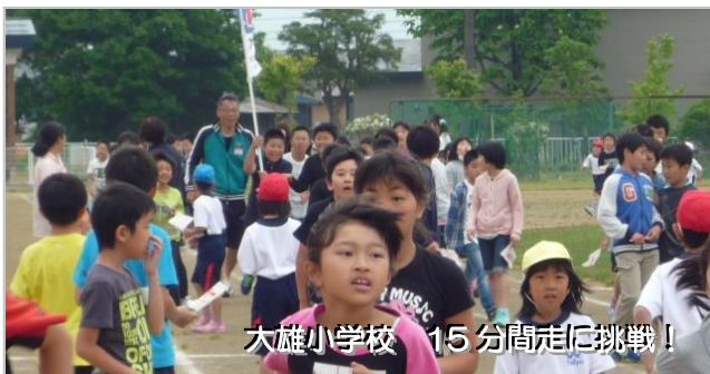
大雄小学校 15分間走に挑戦!