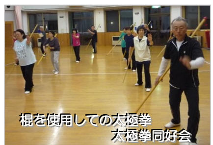
棍を使用しての太極拳 太極拳同好会