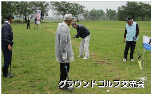
グラウンドゴルフ交流会