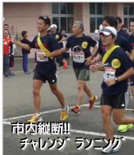
市内縦断!! チャレンジ ランニング