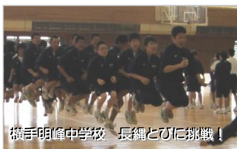
横手明峰中学校 長縄とびに挑戦!