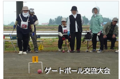
ゲートボール交流大会