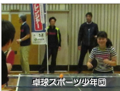
卓球スポーツ少年団