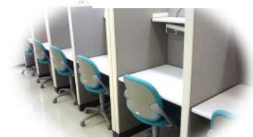
涼しい図書室で勉強しませんか？