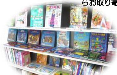
絵本コーナー☆ミッケが大人気♪