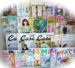
雑誌も自由にご覧下さい