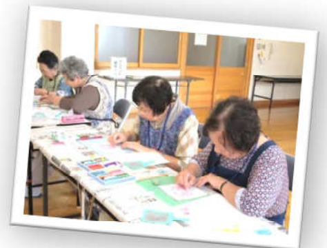
パステルなごみアート体験