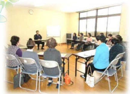
警察官による講話