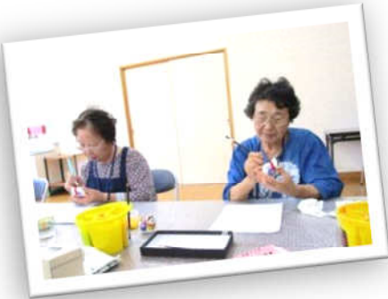
中山人形の絵付け体験教室