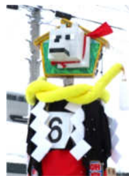
朝倉碓 小若ぼんでん

2月16日（金）横手市役所本庁舎前で梵天コンクールが開催されました。華やかな梵天と、活気溢れる若衆が賑わいをみせました。