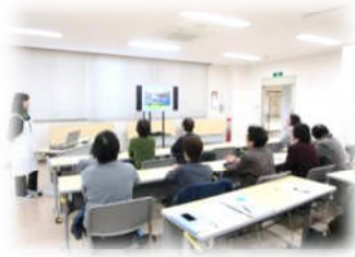
横手学校給食センター見学