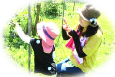
旭公民館共催 親子ブルーベリー摘み体験