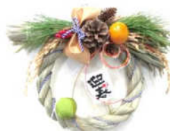
お正月飾り作り講座