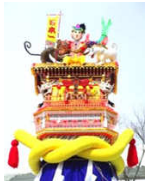
石町信和会 三等 旭岡山神社奉賛会会長賞

2月16日（金）横手市役所本庁舎前で梵天コンクールが開催されました。華やかな梵天と、活気溢れる若衆が賑わいをみせました。