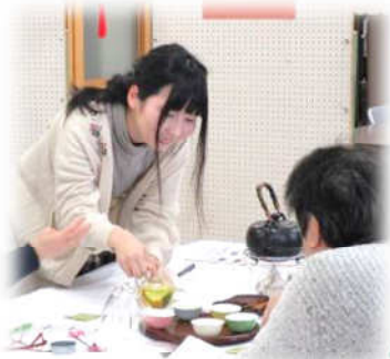
心と体を温める中国茶体験