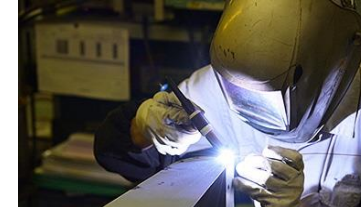
▲ 大仙工場の板金溶接作業