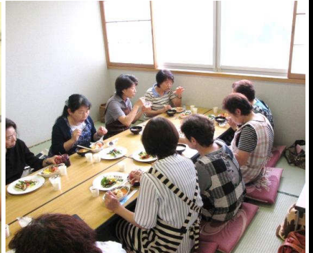
美味しいの連発でした