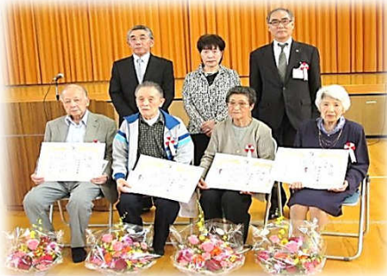
米寿おめでとうございます