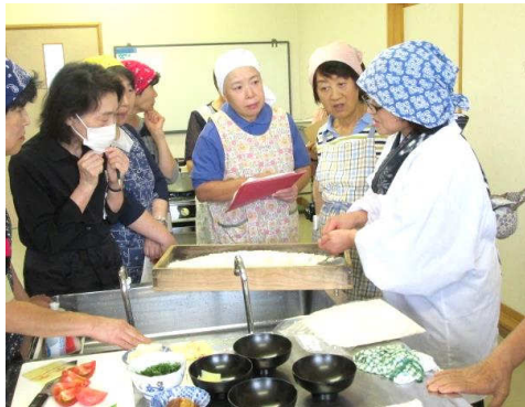
だし箱に入った生のこうじを拝見