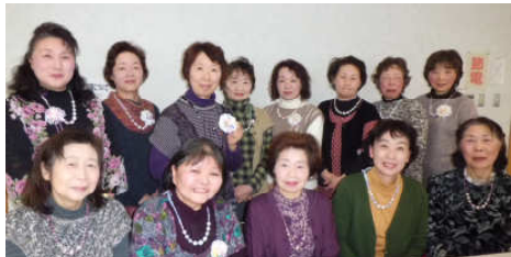
完成したネックレスとコサージュをつけてパチリ！

公民館スタッフ5人が順番に行った講座はいかがでしたでしょうか。楽しんでいただけたら幸いです。ご参加いただいた皆さま、ありがとうございました。