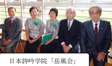
日本詩吟学院「岳風会」