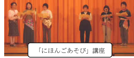
「にほんごあそび」講座