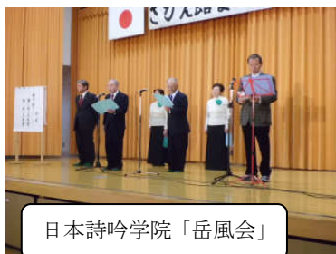
日本詩吟学院「岳風会」