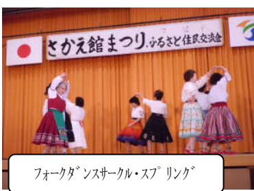
フォークダンスサークル・スプリング