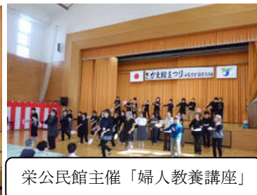
栄公民館主催「婦人教養講座」