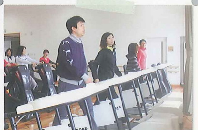
トレッドミルを使った 有酸素運動。