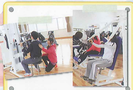
高齢の方でも無理なくできる トレーニングマシンによる運動。