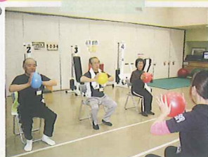
エクササイズボールを 使った運動。