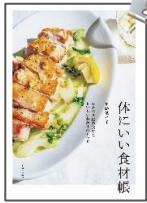
『体にいい食材帳』 齋藤 菜々子／著