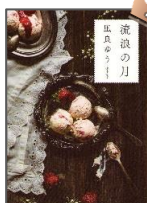
『流浪の月』 凧良 ゆう／著