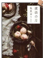
『流浪の月』 凧良 ゆう／著