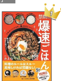
『禁断の爆速ごはん』 およね／著