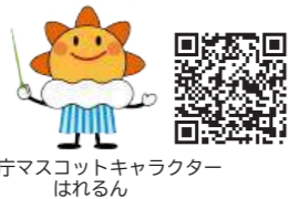
気象庁マスコットキャラクターはれるん