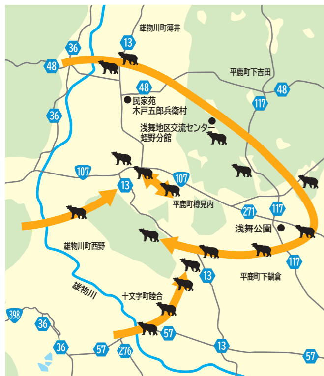
○雄物川の西側から川を渡って出没。平鹿地域、十字地域への広い範囲を移動するクマも珍しくありません