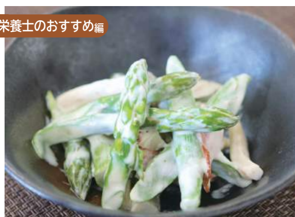
アスパラのマヨネーズサラダ