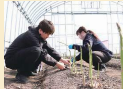
▲入校してしばらくは、旬となった『アスパラガス』の収穫体験から一日が始まります

平成24年度から始まった当該研修事業は、これまで50人の修了生を輩出し、9割以上が就農しています。『農業』という新たな可能性を見出した二人の活躍にも注目です。