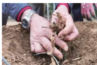
▲宮崎で栽培しているホップ(カスケード)の株を確認の様子