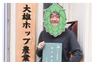
▲スマート農業指導士の認定証書をいただきました

ビール』さんが、南国宮崎でチャレンジしているホップ栽培の視察に行ってきました。気候や品種の違いはありますが、作業負担を軽減する工夫や選芽の効果的な手法などのアドバイスを頂きました。横手の栽培技術が、全国の新規参入者のお手本になり、産地として横手の評価が高まっていくことを期待しています。