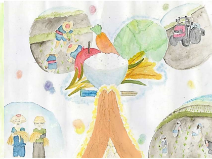
「手からつながるわたしたちの食卓」