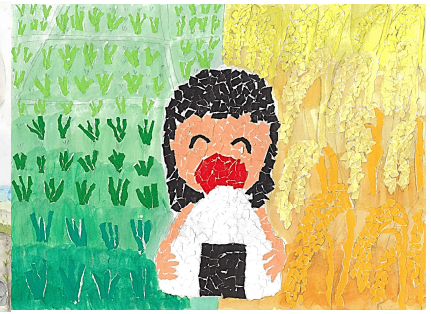
「私のおにぎりができるまで」