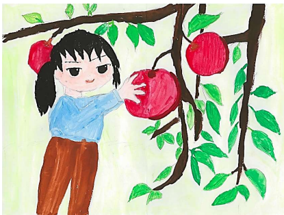
「思い出のりんご狩り」