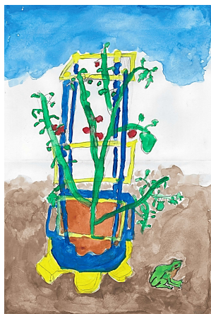
「庭で育てたミニトマト」