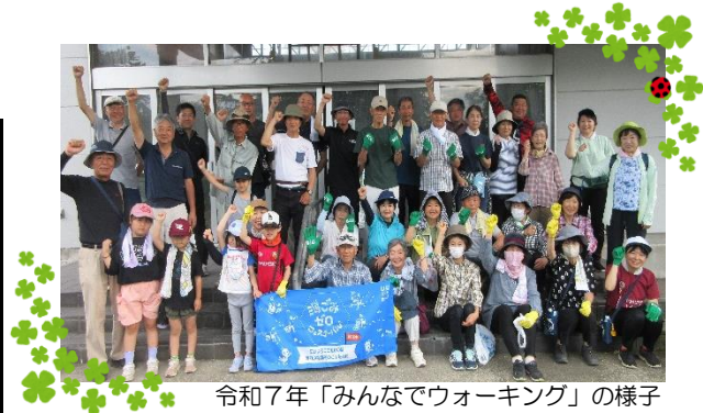
令和7年「みんなでウォーキング」の様子