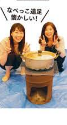
なべっこ遠足懐かしい!