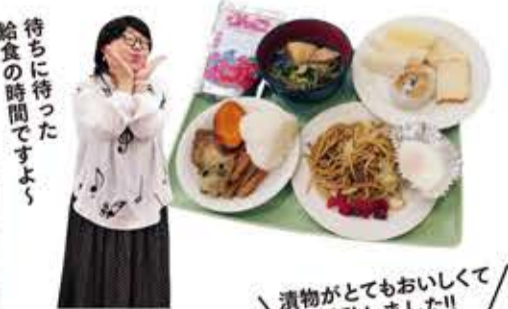
待ちに待った給食の時間ですよ!