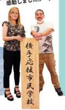
横手応援市民学校