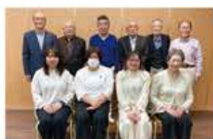
役員会の出席メンバー。

役員に新たなメンバーが加わりました! 首都圏に住む、横手市増田町出身者および関連者の親睦を目的として年1回の総会と交流会を30年以上実施してきました。 さて、長かったコロナ禍もやっと落ち着きを見せ、例年11月の第3日曜日開催している秋の総会と交流会を11月20日(日)に開催できる運びとなりました。今号を皆さまがご覧になるときは、無事に開催できているものと確信しております。 9月14日の増田花火大会には協賛の花火を打ち上げ、ふるさとの方々に首都圏増田会が東京で元気に頑張っていることをお伝えしました。 また、年に3〜4回開催していた役員会もやっと再開できました。4年ほど前から役員顔ぶれもだいぶ変わって若手女性が増えております。