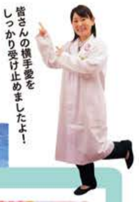
皆さんの横手愛をしっかりと受け止めましたよ!

遠方に住んでいても横手を応援したいという熱い思いをもった「横手応援市民」の方々。横手市が抱える課題についての授業を受け、参加者は自分たちにできる応援の形を考えました。皆さんから寄せられた応援宣言をご紹介します。