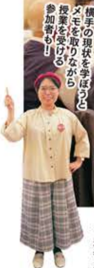
横手の現状を学ぼうとメモを取りながら授業を受ける参加者も!

10月2日(日)、ホテルポール麵町を会場に開催した「横手応援市民学校なべっこ遠足in東京」。3年ぶり4回目となる今年は80名を超える参加者にお越しいただき、秋田の秋の風物詩「なべっこ遠足」を楽しんでいただきました。 なべっこ遠足とは、秋田県内の小中学校等で行われる一大行事です。少人数のグループに分かれ、鍋を持って、横手好き、集合! くる人、食材を持ってくる人など役割分担をしたうえで、子どもたちだけで鍋っこ(いものこ汁など)を作ります。 この日は、学校の先生に扮した市職員が生徒(参加者)に、市の取り組みや横手との関わり方をレクチャーする授業からスタート! 応援市民の「横手を応援したい」という気持ちの醸成と継続がいかに重要か熱弁しました。応援市民のみなさん、これからも横手のことを想い、考え、応援してくださいね!