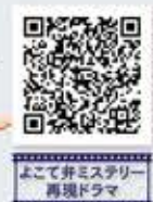
よこて弁ミステリー再現ドラマ