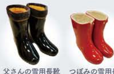
父さんの雪用長靴 つぼみの雪用長靴