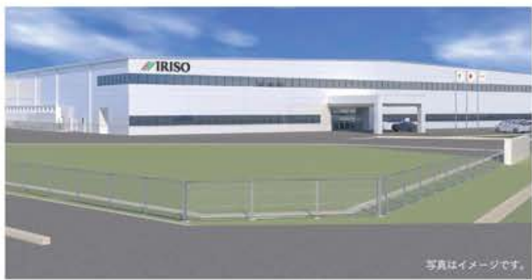
新設される秋田工場完成予想図。工場の面積は2万2000平方メートル。自動車のパワートレインなどに使われる特殊なコネクタを中心に製造する。