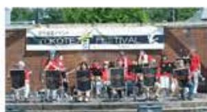
総会でアトラクションを予定している「Yokote Heroes」。

平均年齢も大幅に下がり、女性の比率も高くなりました。LINEやZoomなどを通じて頻りに情報交換を行っております。 2023年11月19日(日)には、第38回総会を上野・オーラムにおいて例年どおり開催できますことを楽しみにしております。その際には大勢の皆さまのご参加をお待ちしております。皆さまと一緒に総会と交流会で元気な顔を確認し、再会を喜び合いたいと思います。