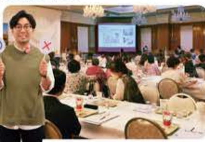
若者の定着に不可欠な就労支援についても理解を深めていただきました!

来場した方は、すでに横手応援市民! より深く横手について知り、さらなる関係深化のための授業を行いました。移住定住、就農・発酵サミット、就労など横手の現状や課題について真剣に聞いていただきました。授業により、参加者一人ひとりが横手市への応援を「自分ごと化」し、具体的な行動に結びつけるための一助になってくれればと思います。