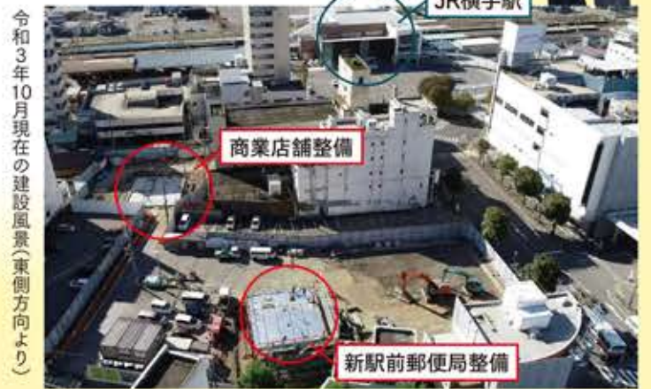
令和3年10月現在の建設風景(東側方向より)

PR POINT 20歳前後の社員中心の若い会社です。若手の教育に力を入れ、技能習得のため、イイダ産業株式会社(愛知県)で研修を行う研修制度があります。