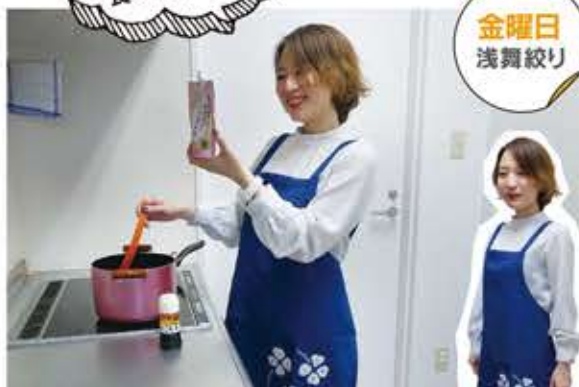
浅舞絞りのエプロンで、週末のごほうび料理。おいしいもの作るぞ！