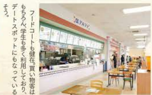
フードコートも健在。買い物客はもちろん、学生も多く利用しており、デイトスポットにもなっているそう。