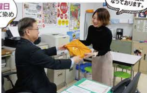
りんご染めの風呂敷で、お世話になっている会社の社長にごあいさつ。