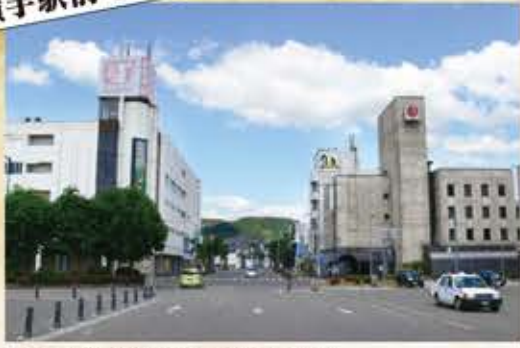
再開発事業区域であるJR横手駅東口