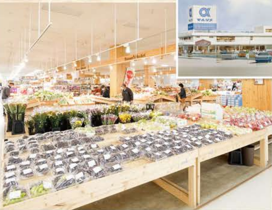
平成23年に「ファーマーズマーケット」を開設。現在約400名の会員が自慢の農産物や加工品を出品し、お店のにぎわいに一役買っている。