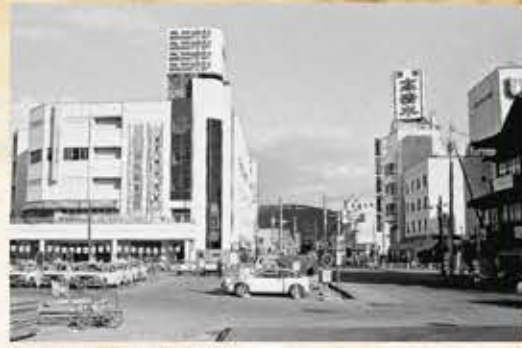
昭和53年(駅東口より)