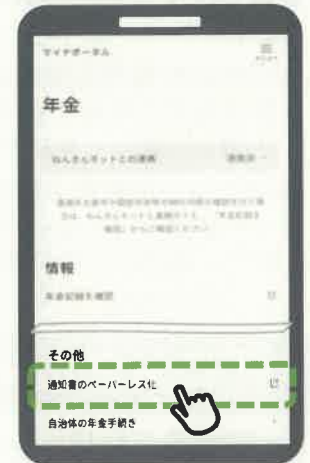
【ステップ2の画面イメージ】