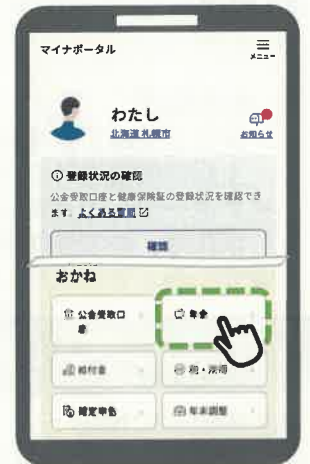
【ステップ1③の画面イメージ】