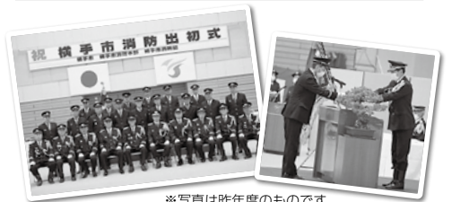
※写真は昨年度のものです