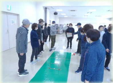
最初はグー、ジャンケンポン!

本番前に2日間練習日を設けましたが、中には2日続けて練習して本番を迎えた方もいました。果たして練習の成果はあったのでしょうか……。