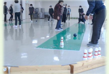
最後の一本がなかなか……