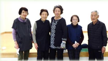
優勝したチームクローバーの皆さん