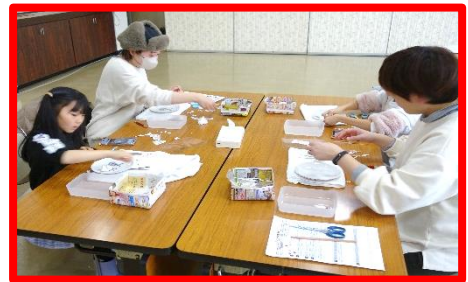
【おやこポーセラーツ講座】 令和6年2月4日(日)