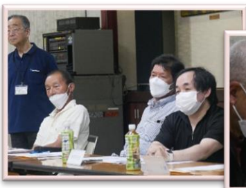
【ネットワーク会議】 令和5年7月12日（水）、11月28日（火）