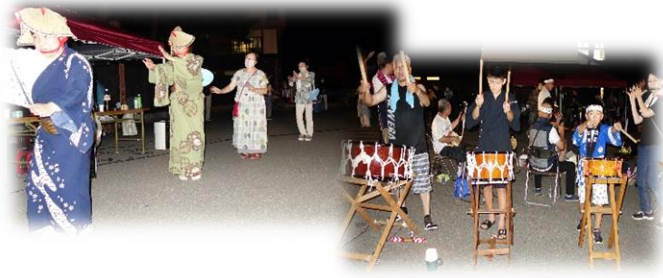
【増田盆おどり】 令和5年8月15日（火）