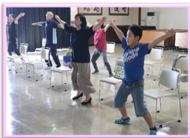
【エンジョイ事業（おやこラジオ体操）】 令和5年7月30日（日）、8月27日（日）、9月24日（日）