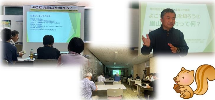
【ミニ講座(よこての里山を知ろう!)】 5回開催 (座学)・・・令和5年6月7日(水)、8月1日(火)、10月4日(水)、12月9日(土)