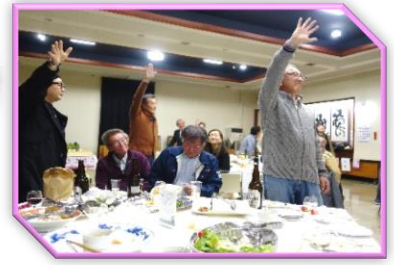
【増田でお酒を楽しむ会】 令和5年11月18日(土)