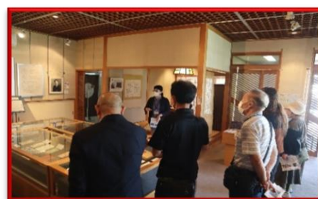
【視察研修会】 令和5年9月7日（木）