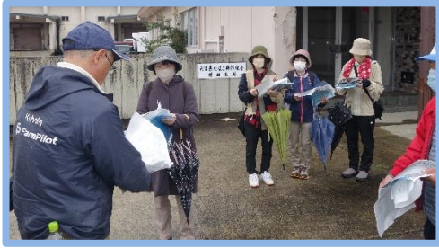
【古の路を歩く～増田古道散歩～】 令和5年10月29日(日)