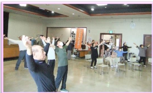
【チャレンジデー】 令和5年5月31日(水)