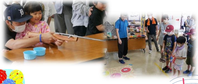
【地区交流センターまつり】 令和5年7月2日（日）