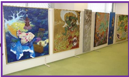
【第55弾 ミニ企画展「絵画展～私の世界」】 令和6年2月3日(土)～2月25日(日)