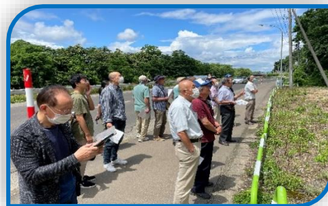
【横手市民大学講座】 令和5年6月24日(土)