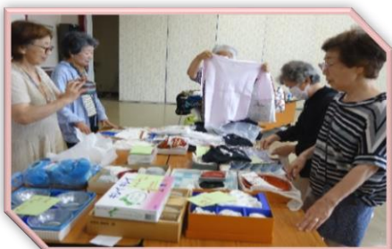
【フリーマーケットinますだ】 令和5年8月20日（日）