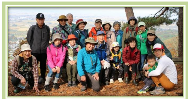
(真人山散策)・・・令和5年11月5日(日)