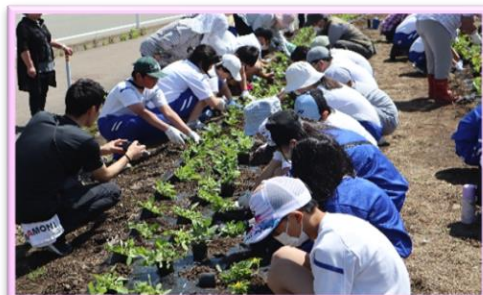
【花いっぱい推進運動】(増田町婦人会共催) 令和5年6月5日(月)