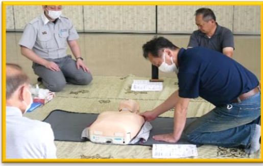
【救急救命講習会】 令和5年6月25日（日）