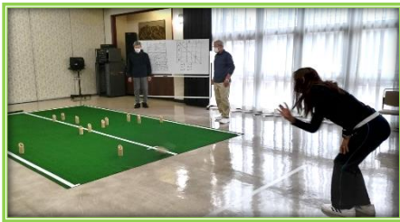
【ニュースポーツ体験会(モルック)】 令和5年11月19日(日)