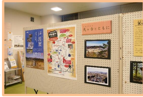
【第54弾ミニ企画展「戸波展」】 令和5年6月25日（日）～7月16日（日）