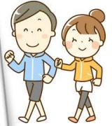
【わくわくウォーキング in 象潟】 令和5年10月28日(土)