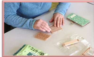
【創作講座(組子細工)】 令和5年12月5日(日)