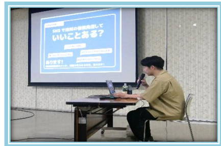
【YouTuberから学ぼう】 令和5年7月28日（金）