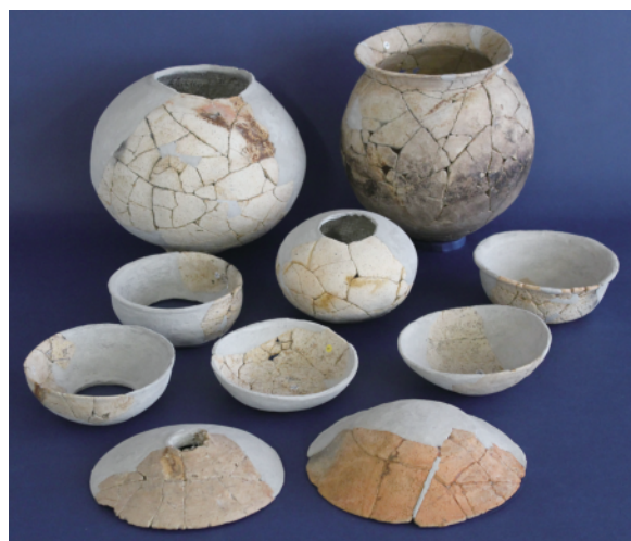
表裏写真は、一本杉遺跡（平鹿地域）の 竪穴住居跡と出土土器