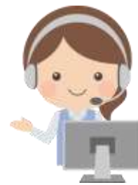
通訳コールセンター