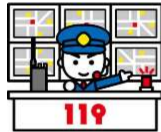
消防指令センター

日本語以外の言語で119番通報した場合、消防指令センターから通訳コールセンターに転送されます。通訳コールセンターには通訳をお願いしています。転送中はしばらくお待ちいただく必要があります。電話は切らないでください。通訳を介して 母国語でコミュニケーションをとることができます。