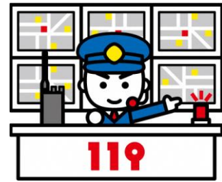
소방 정보통신 센터

일본어 이외의 언어로 119로 전화가 왔을 때, 소방정보 통신 센터는 통역 콜센터를 연결시켜 통역사와 같이 대화합니다. 연결할 때는 시간이 잠깐 걸립니다만 끊지 마시고 기다려 주십시오. 기다리시면 통역사를 통해 모국어로 대화가 가능합니다