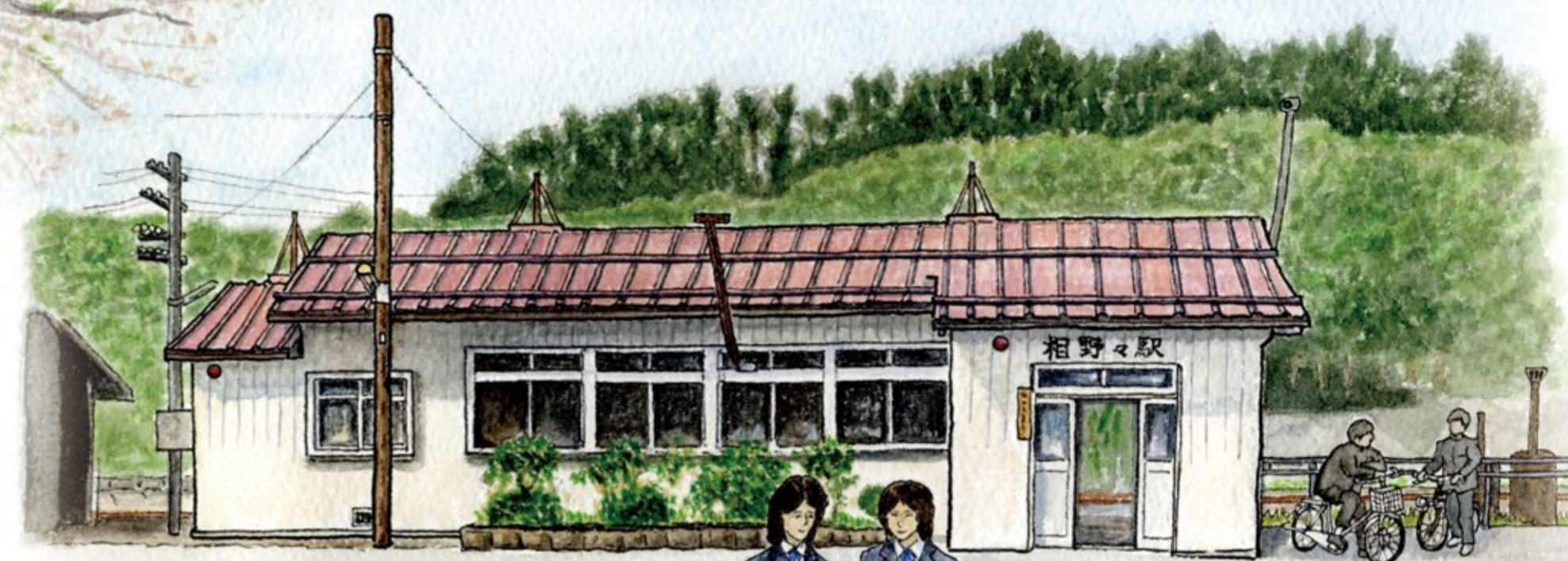
北上線経由で 仙台～秋田間を走っていた 特急「あおば」

駅にまつわるあの日、あの場所、あの時間。 そこには一人ひとり違う『ものがたり』が存在します。 今回は横手-北上(岩手県)間を走る北上線へ。 山深い山内の地にひっそり佇む相野々駅。 かつての駅舎に想いを馳せて…。