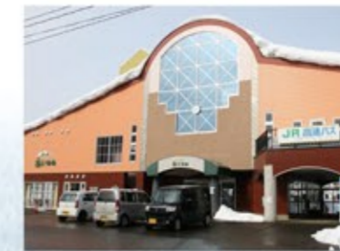
現在の相野々駅写真

《北上線》路線総延長 61.1km 《相野々駅》秋田県横手市山内土濁字中島 開業日：1920年(大正9年)10月10日