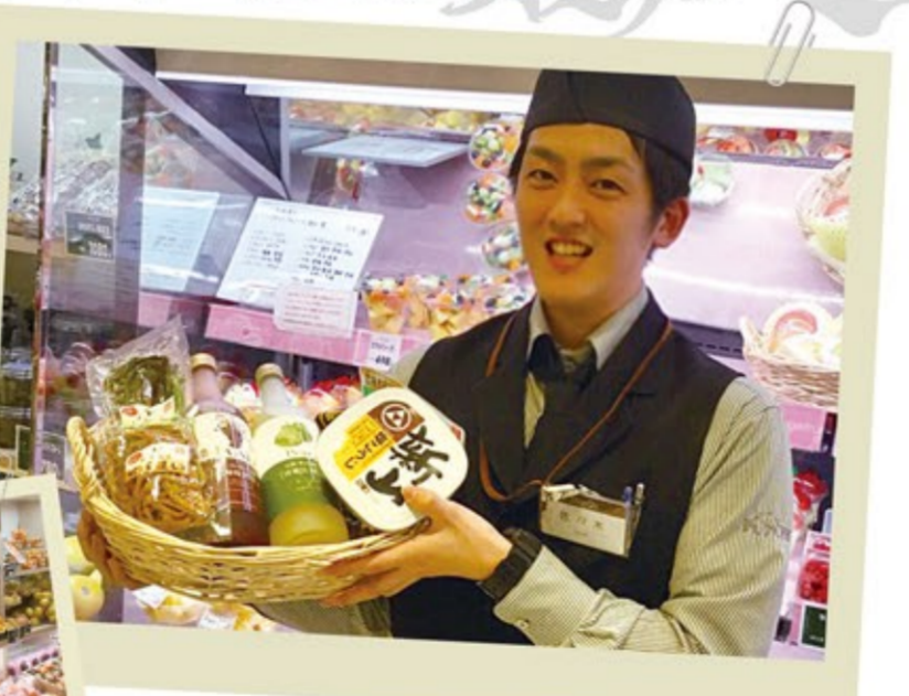
ナチュラルマーケット (九州屋+大地を守る会) 渋谷ヒカリエShinQs店 東京都渋谷区渋谷2-21-1 渋谷ヒカリエShinQs B3 TEL.03-6434-1884