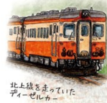
北上線を走っていた ディーゼルカー