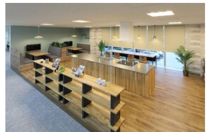
新社屋 カフェスペース