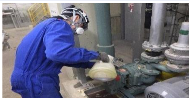
電動機の点検オイル交換