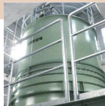
粉末活性炭注入設備(大沢第二浄水場)

ただ、まれに水源において浄水場の処理能力を大きく超えるかび臭物質が発生し、水道水ににおいが残る場合があります。