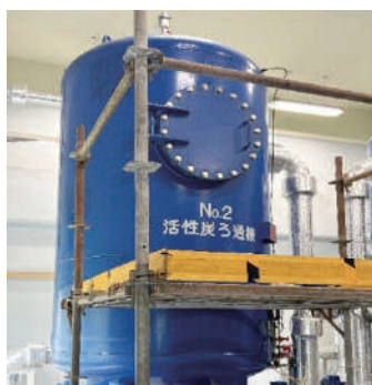
粒状活性炭ろ過設備(前田浄水場)

昨年の7月、水道水の臭気(かび臭等)について、大森の前田地区のみなさまから多数のお問い合わせをいただきました。