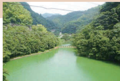
ダムにおけるアオコ現象の事例 (国土交通省技術資料より)

水道水源の一つである河川やダムにおいて、かび臭の原因物質を産生する藻類の発生により、水道水にかび臭などの不快なおいが付く場合があります。特に近年は、温暖化の影響によりその頻度が高くなってきています。なお、かび臭物質に毒性はなく、飲用しても健康上の影響はありません。