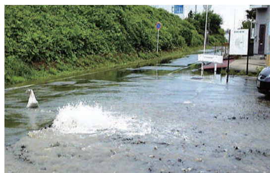
市内で発生した道路漏水事故のようす

そのため、横手市では 管路の年間更新率を引き上げ(0.3%→0.5%)、管路更新を進めていきます。