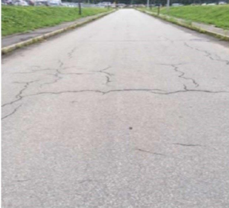
ひび割れた舗装・・・メンテなし