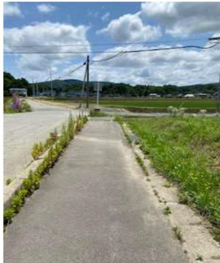
興業団地内は舗装されており 街路灯も明るい