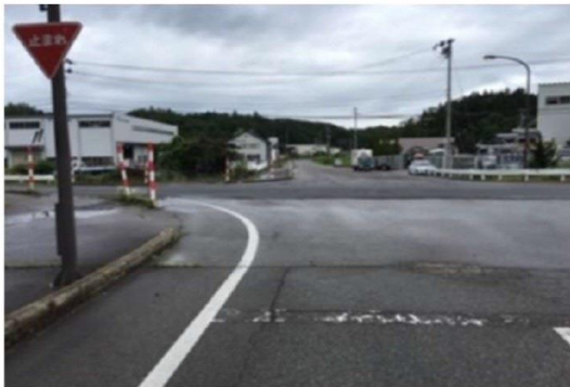
消えかけている停止線