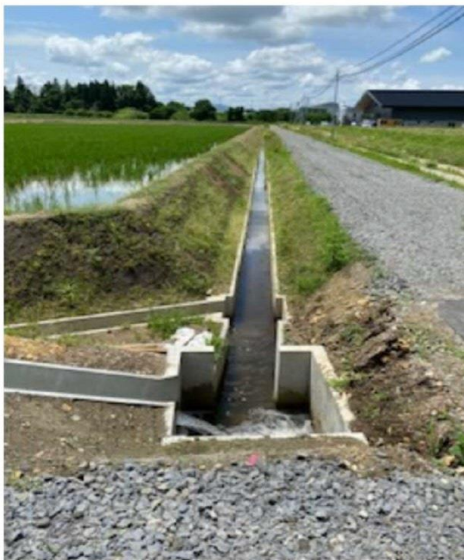
田んぼ造成で新設された排水溝 ・・・落下防止の蓋なし