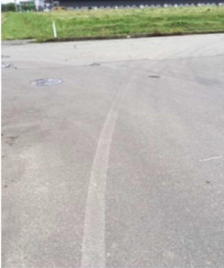
消えかけているセンターライン