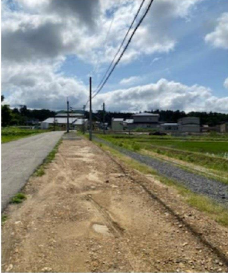
柳田駅に通じる道・・・歩道未舗装、街路灯暗い