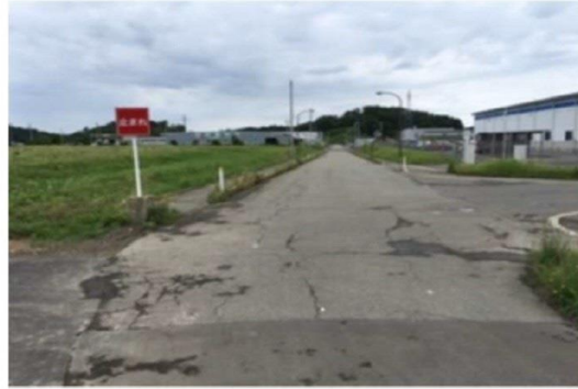
工業団地に入る直前の停止線 ・・・停止線が最初から引かれていない