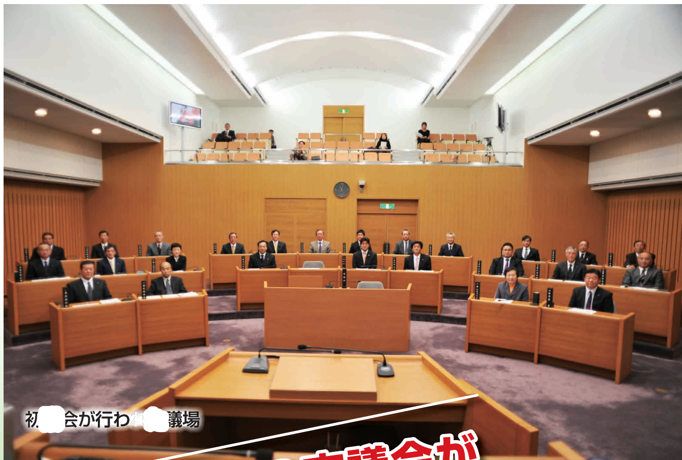
初会が行われた議場