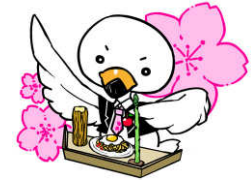
横手市議会マスコット 「しらとり議員」