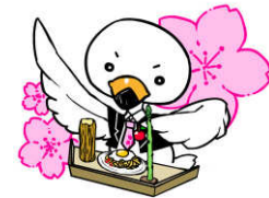
横手市議会マスコット 「しらとり議員」