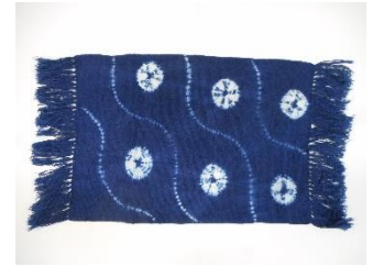
※写真は今年のテーブルセンター