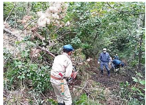
チェーンソーを使って伐採している様子

10月6日、さかえ市民会議事業として鬼嵐地区の大屋館登山道の整備が行われ、参加者13名(市民会議役員・市担当職員)が作業をしました。頂上までの道のりは草木が長く生い茂り、草刈り機やチェーンソーを使って取り除きました。終了後は登山道も登りやすくなり、大屋館に足を運びやすくなりました。地域の歴史ある場所を大事に守っていく住民の皆さんの心意気が感じられた有難い事業でした。