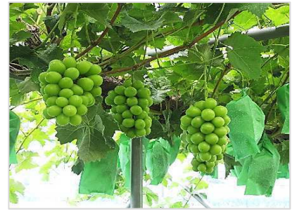
たわわに実ったぶどう