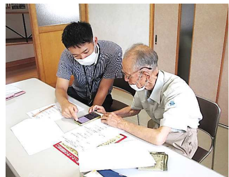
使い方を丁寧に指導してくれました

情報政策課主催のスマートフォン活用講座が8月24日さかえ館にて開催されました。65歳以上の方を対象にしたこの講座では参加者の皆さんが講師の指導を聞いて使い方を学んでいました。また、横手警察署よりスマートフォンを使った特殊詐欺への注意喚起もありました。便利なスマートフォンですがご利用には十分に注意して、楽しんで活用していただきたいものです。