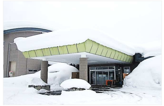
さかえ館も雪に覆われました（2月8日撮影）