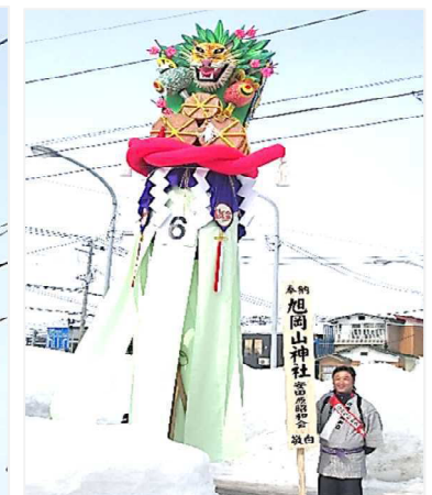
三等（横手市長賞）・優秀賞（A A B秋田朝日放送賞） 特別賞（花巻市長賞）

※両梵天は2月17日、旭岡山神社に無事奉納されました。取材協力ありがとうございました。