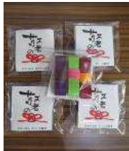
ピハラー横手職員の皆さんの手作りプレゼント

9月18日、境町地区敬老会が行われました。今年は約150名の方々が出席され、うち米寿を迎え参加された3名の方へ、高橋大市長より祝い状などが贈られました。