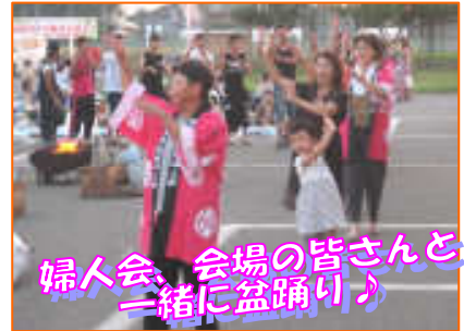
婦人会、会場の皆さんと一緒に盆踊り♪

8月5日、ふるさと館を会場に夏祭りが行われました。会場では、盆踊りやバルーンアートショー、カブトムシ抽選会などが行われ多くの人でにぎわい、模擬店も大盛況でした。夏祭りの最後を飾るスターメインショーでは、花火が打ち上がるたび、会場では大きな歓声が上がっていました。