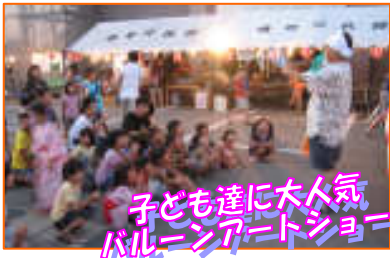
子ども達に大人気バルーンアートショー