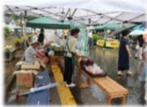
【後三年秋の陣へ出店】