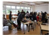
【ふれあい文化祭へ出店】