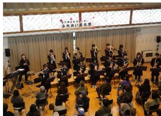
横手北中学校吹奏楽部