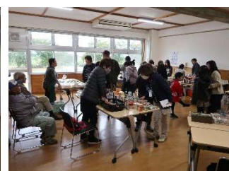
教養講座展示ブース