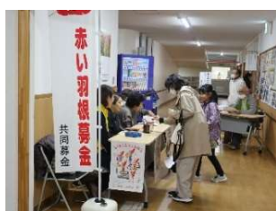
赤い羽根共同募金

ステージ発表はもちろん、子ども連れ・老若男女の皆さんで館内の各ブースも賑わいました。昼食時には、いものこ汁とあきたこまち新米おにぎりのおふるまいがあり、秋の味覚を堪能し、ふれあいの場となりました。